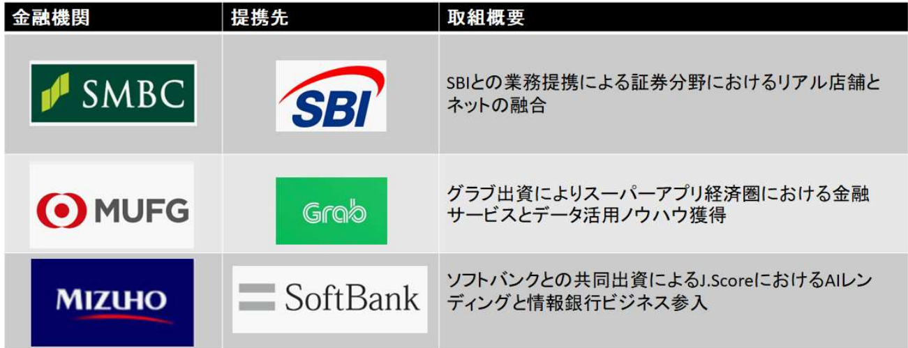
図表 2 大手銀行グループの取組状況

いつでも、どこでも金融機関が提供するサービスにアクセスできるようになりつつあります。